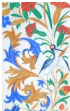
Enluminure © Callibris.

Patrimoines écrits en Bourgogne-Franche-Comté allie la « pratique » à la « théorie » : les expositions, présentations de documents et conférences se prolongent à travers des ateliers découverte pour expérimenter les techniques de fabrication, de couleurs et de décorations spécifiques aux ouvrages anciens, et créer ses propres documents.