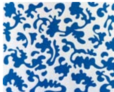
Résidence d'artiste - Exposition Abécédaire