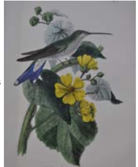
Histoire naturelle des oiseaux... suivant la classification de Isidore Geoffroy-Saint-Hilaire, Emmanuel LE MAOUT, Paris, Curmer, 1853. BM Vesoul, fonds Petitclerc.